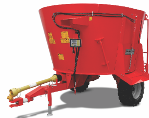
Vertical 3.5 / 6.0